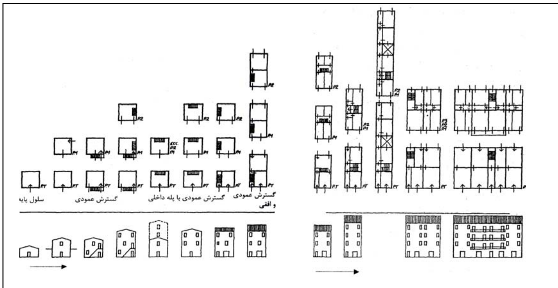
شکل ۳ ترسیم رشد گونه از ساده به تکامل یافته، از خانه ردیفی تا خانه خطی. (از چپ به راست) خط افقی گسترش زمانی و خط عمودی گسترش عمودی و تکاملی بنا را نشان می‌دهد [۲۵].

۲- انتخاب و بازشناسی گونه پایه (گونه پایه واحدی است که از آن گونه‌های کامل‌تر آغاز می‌شود): (یک اتاق یا یک خانه مسکونی) با استفاده از شواهد باستان شناسی و بازسازی تصویری. ۳- بررسی روند رشد کالبدی گونه پایه و عوامل مؤثر در این رشد: این رشد تابع قوانین کمی همانند دو برابر شدن