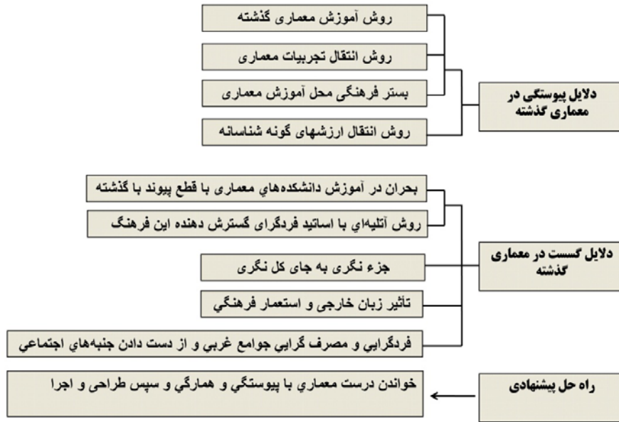
شکل شماره ۱ ریشه‌های بحران معماری در حوزه‌های آموزشی، پژوهشی و اجرایی و راه حل آن

در این میان موراتوری‌ها با اهمیت قائل شدن برای این موضوع، پس از بیان اینکه محصولات معماری گذشته دارای ارزش‌های گونه شناسانه بوده‌اند، در پاسخ به چگونگی بروز این ارزش‌ها و در پاسخ به رابطه ذهن و عین و ارتباط آن با معماری از اندیشه‌های «کروچه» بهره می‌گیرند. از نگاه آنها، انسان به وسیله ساختار ذهن خود، واقعیت‌های بیرون را به درون ذهنش انعکاس می‌دهد. او آنچه از طبیعت می‌بیند در ذهنش تبدیل به ساختاری عددی کرده و بر اساس همین ساختار اقدام به عمل می‌کند. ذهن انسان همه چیز را در طبیعت می‌بیند و فرا می‌گیرد و هیچ چیز را خود خلق نمی‌نماید [۲۴].